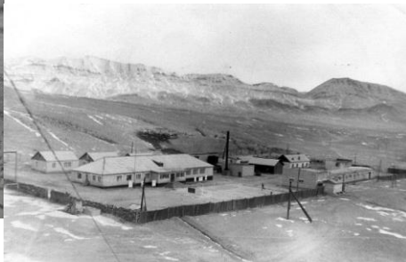
Таджикистан. г.Мургаб. Застава