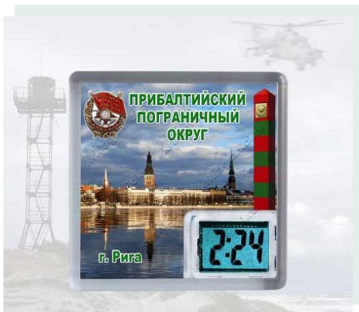
Прибалтийский пограничный округ

По окончании командировки в Демократическую Республику Афганистан, служил в г. Риге, а с 1988-1992 годы возглавлял отдел агитации и пропаганды Прибалтийского пограничного округа. Затем служил в Москве в Управлении пограничных войск ФСБ России, был начальником отдела воинской дисциплины до 1998 года.