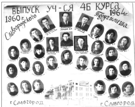
Выпуск учащихся 4 Б курса (1964)