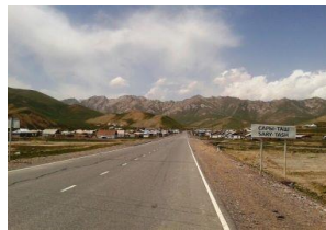
Киргизия. п. Сары-Таш