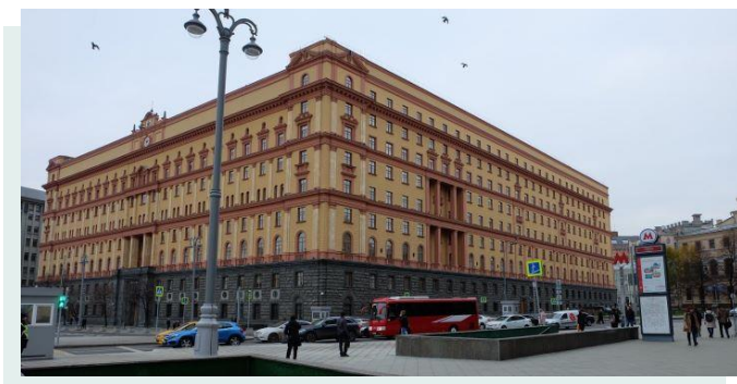
Управление пограничных войск ФСБ России