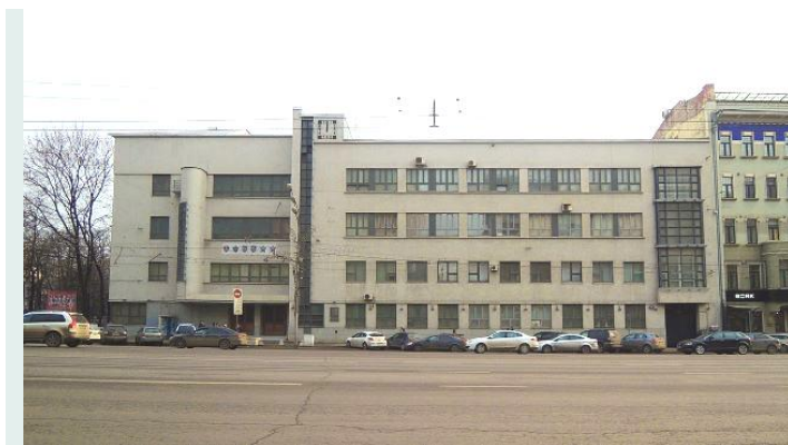
Здание Военно-политической академии

Учебное заведение существовало с 1919 по 1991 год (ВПА была преобразована в Гуманитарную академию ВС РФ). С 20 июля 1994 года Гуманитарная академия ВС РФ была преобразована в Военный университет МО РФ с включением в ее состав Военной академии экономики, финансов и права (созданной на базе Военного института ВС СССР в ноябре 1992 года).