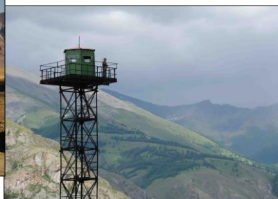
Граница СССР священная и неприкосновенная