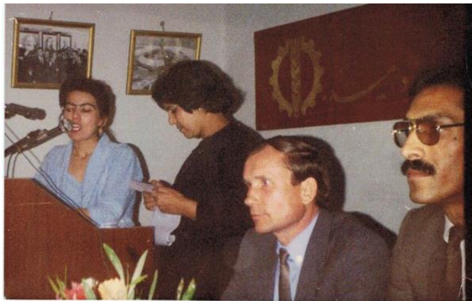
Афганистан. г. Кабул (1985-1988 гг.)