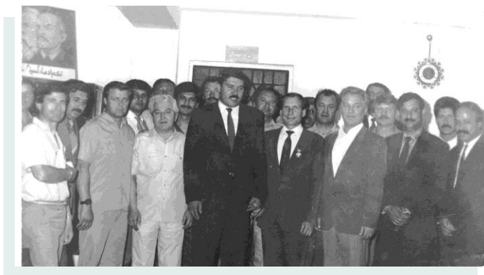
Проводы А.Ф. Макотры из Кабула на Родину (май 1988 г.). Справа от А.Ф. Макотры Президент Демократической Республики Афганистан Мохаммад Наджибулла