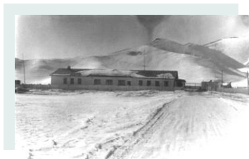
Киргизия. п.Сары-Таш. Застава

Первым местом службы была застава на Памире в местечке Сары-Таш, затем должность заместителя командира по политической части в роте связи в Киргизии городе Ош (1969-1972гг.). С 1972 года по 1976 год был освобожденным секретарем партийной организации в г. Мургаб (Таджикистан), затем была служба в г. Панфилов (Казахстан) и снова г. Ош.