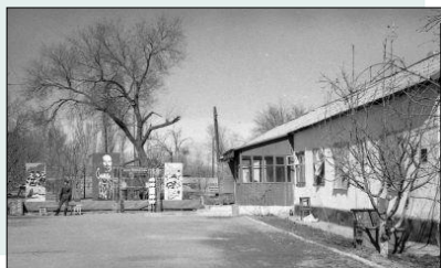
Казахстан. г.Панфилов. Застава