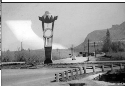
Киргизия. г.Ош. Застава