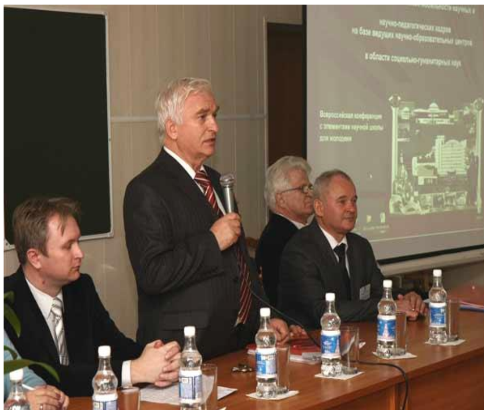
Кандидатские и докторские диссертационные советы