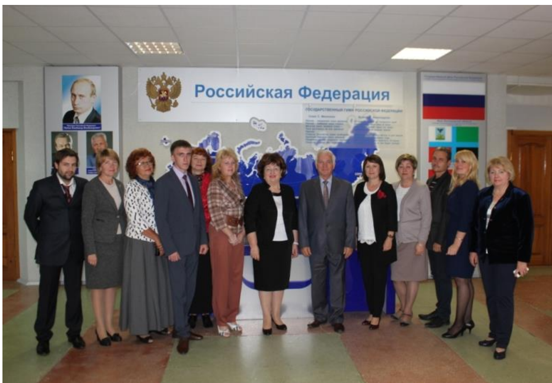
Научная школа «Профессионально-педагогическая культура»