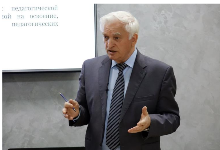
Международные, всесоюзные и всероссийские научно-практические конференции и семинары

... педагогической ... кой на освоение, ... педагогических