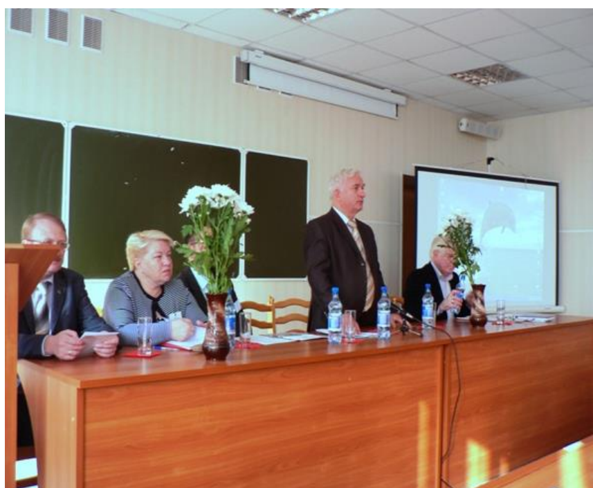
Защита кандидатских и докторских диссертаций