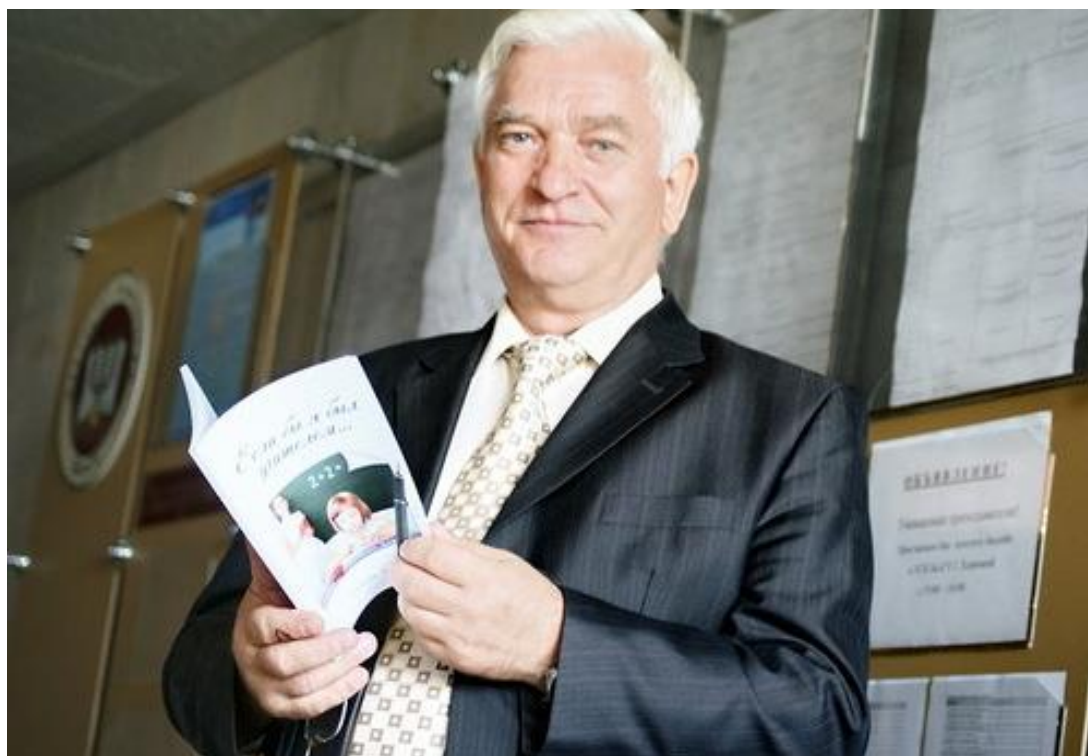
Член редакционных советов педагогических журналов