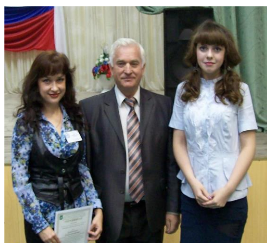
Председатель жюри областных конкурсов «Учитель года»