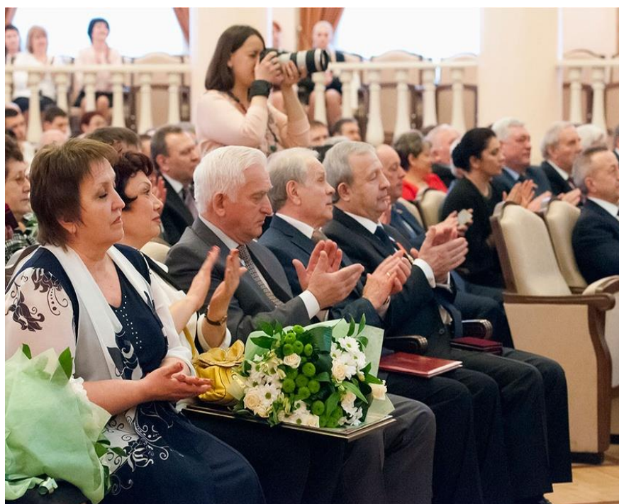
Вручение Медали ордена «За заслуги перед Отечеством» II степени (2017)