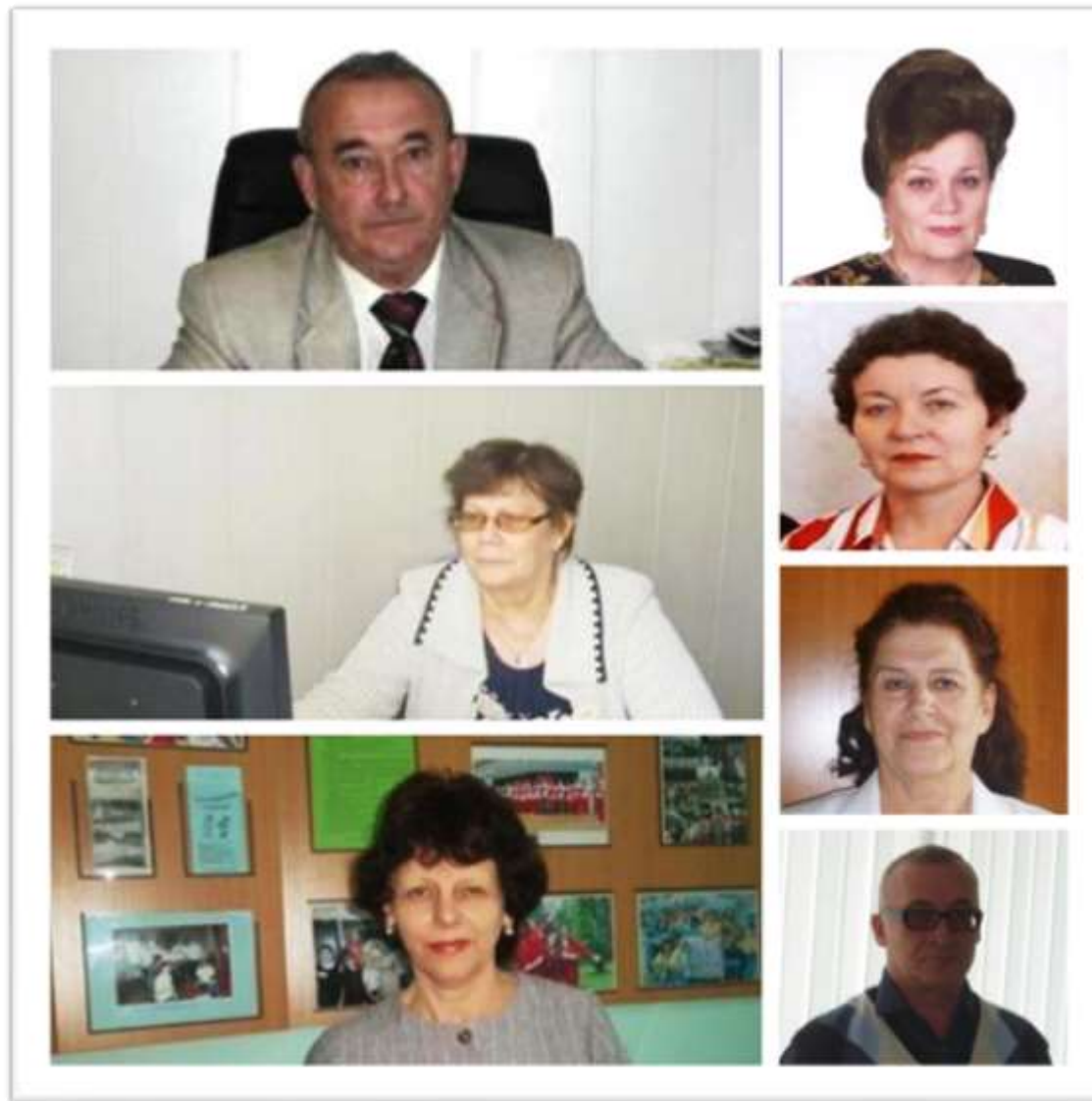
Заслуженные учителя Славгородского педагогического колледжа