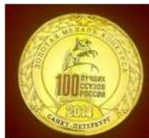
▪ Краевой социально