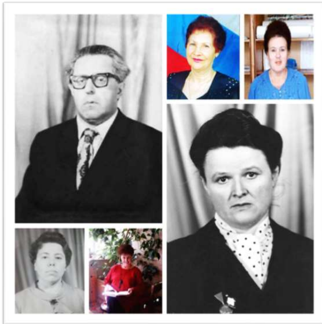
Заслуженные учителя Славгородского педагогического колледжа