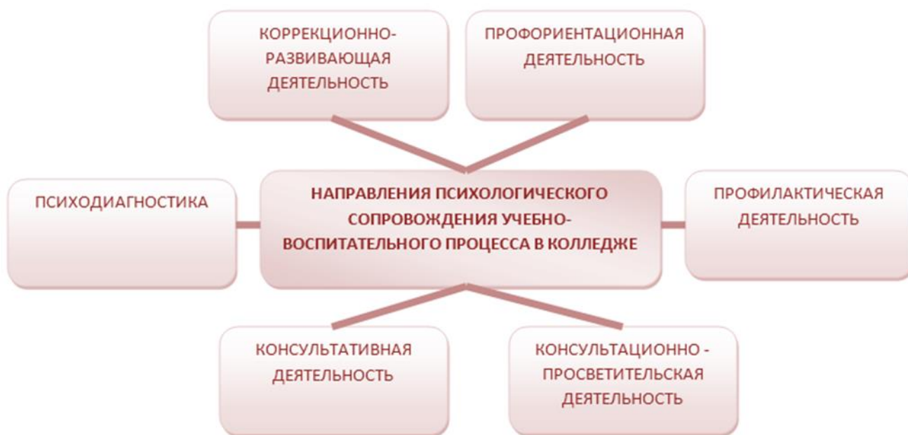
Рис. 2 Направления психологического сопровождения