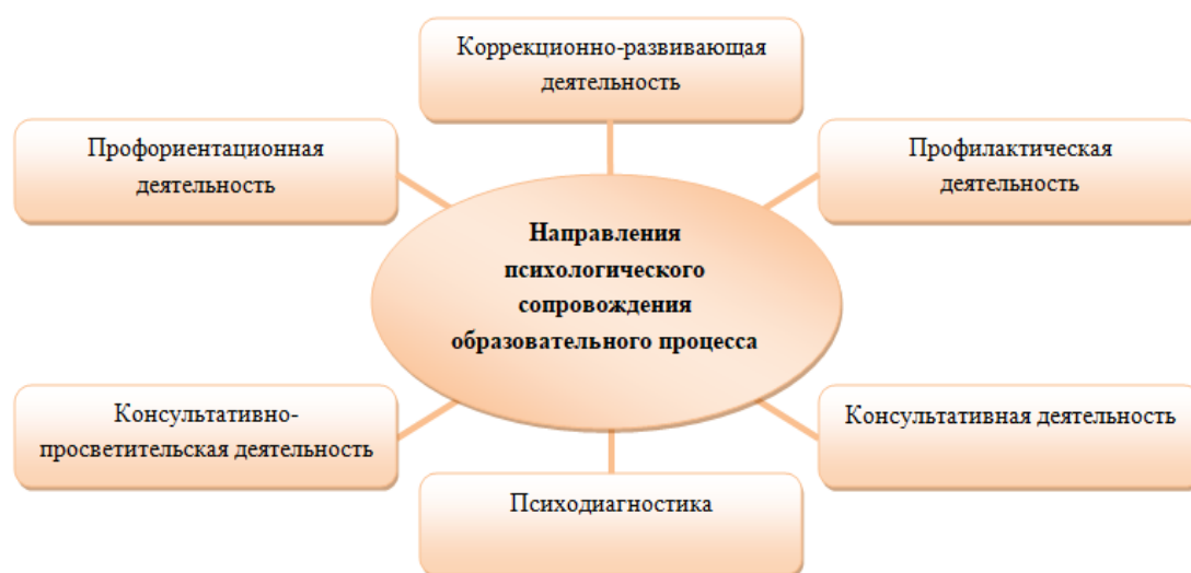
Рис. 2 Направления психологического сопровождения

Направления психологического сопровождения учебно-воспитательного процесса: