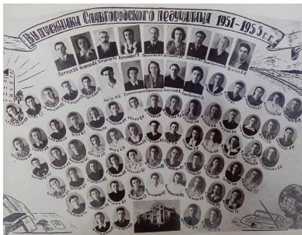
Выпускники Славгородского педагогического училища (1951-1955)