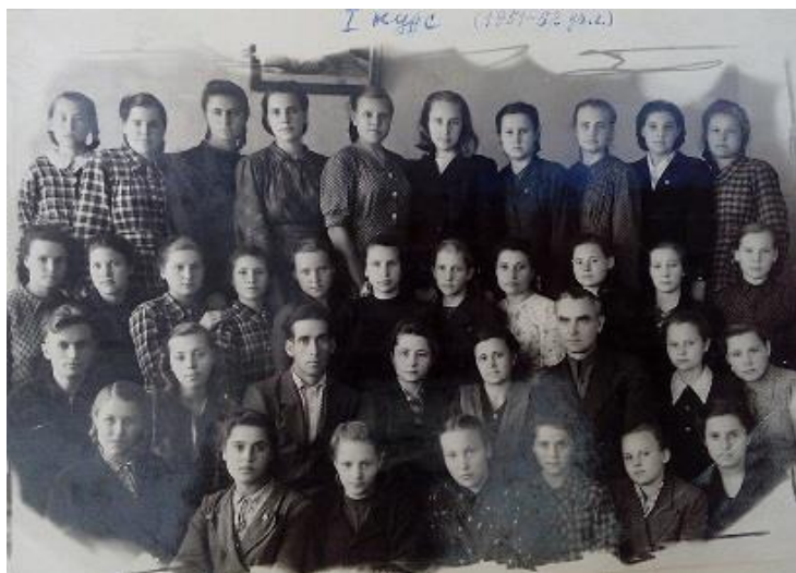
1 курс. 1951-1952 учебный год