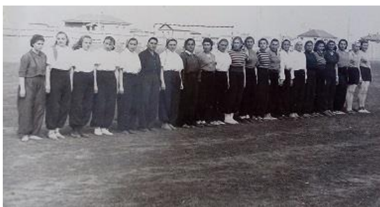
На уроке физкультуры