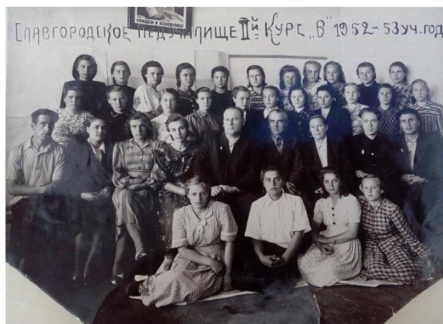
2 курс. 1952-1953 учебный год