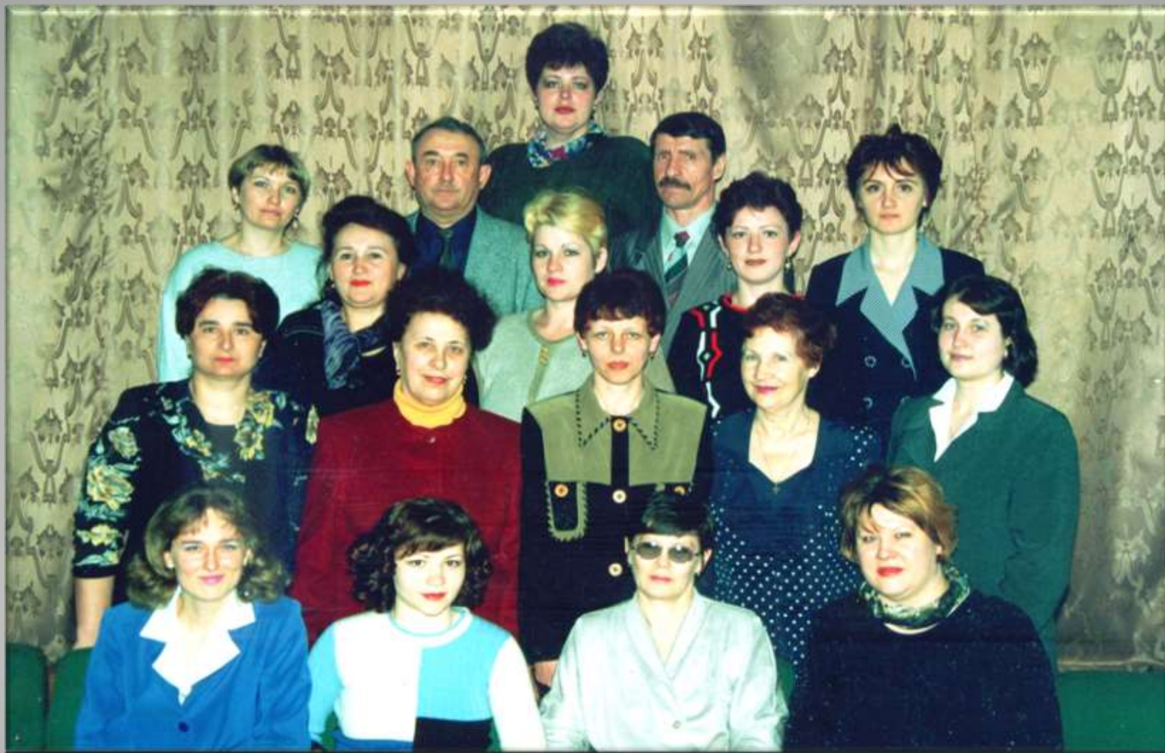
ПЦК педагогики и психологии 2002 год