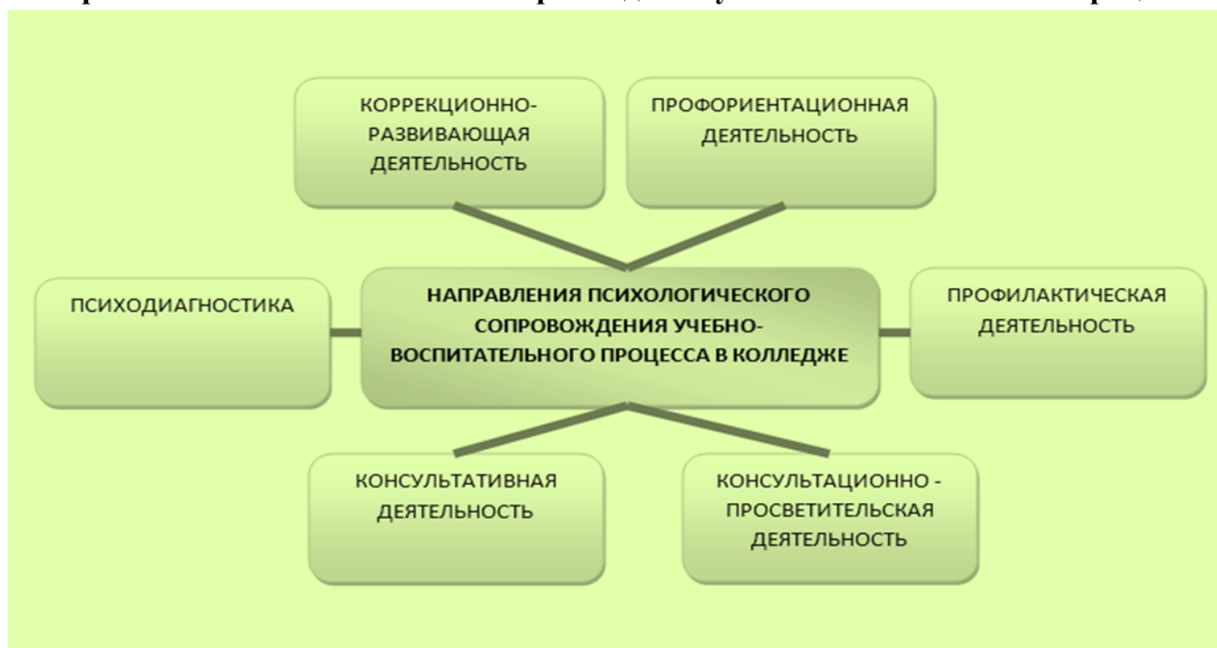
Рис. 2. Психологическое сопровождение